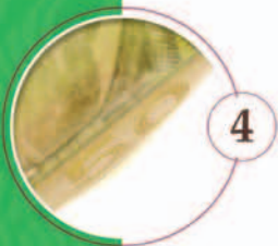
Imagen oculta: en la franja inferior del anverso, ubicada debajo del personaje, se observa el dibujo de un libro abierto. Al inclinar el billete, y de acuerdo con el ángulo de incidencia de la luz, se aprecia el número 50.

Registro perfecto: está conformado por una síntesis gráfica o dibujo del Oso Frontino, una estrella de cinco puntas y minitexto “BCV”. Por el reverso, visto al trasluz, las puntas de las estrellas y el círculo interior se rellenan de manera precisa. Por el anverso, bajo luz ultravioleta, partes del oso frontino, las puntas de la estrella y el círculo interior tienen efectos fluorescentes de color amarillo verdoso.